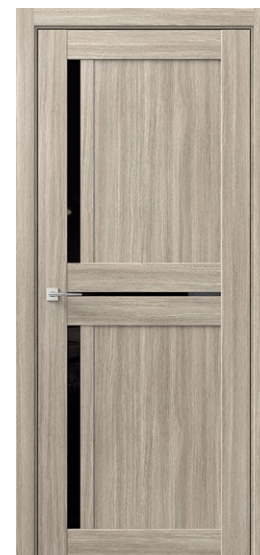
ДЕЛЬТА М Дуб Сицилия