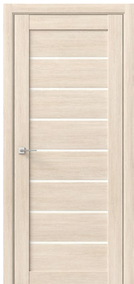
АЛЬФА Амурская лиственница