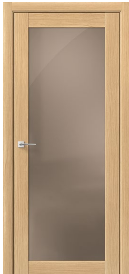
СИНГЛ Дуб Нордик