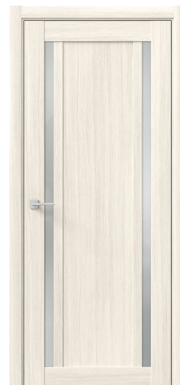
ГАММА М2 Снежная ливн.