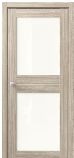
ОМЕГА C2 Дуб Сицилия