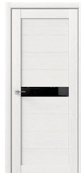
ЛИНК Белый Дуб