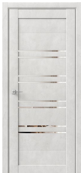
ИОТА 8 Бетон светлый Зеркало