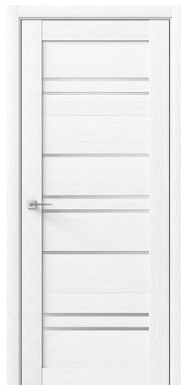
РИТМИК 8 Белый дуб