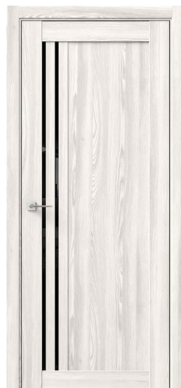
ГАММА СМ Ривьера Айс