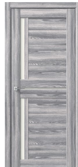
ДЕЛЬТА Ривьера Грей