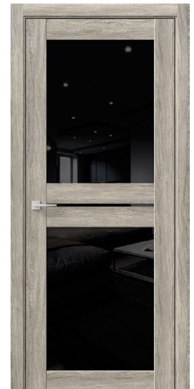
ОМЕГА C2 Дуб пепельный