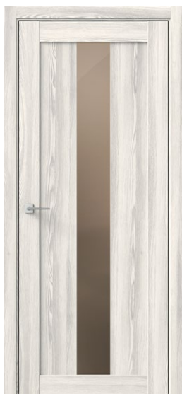
СИГМА Ривьера Айс