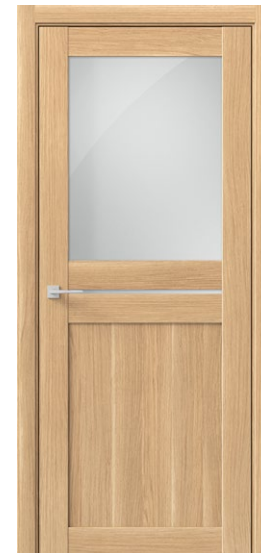
ОМЕГА С Дуб Нордик