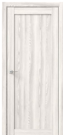
СИНГЛ Ривьера Айс Глухая вставка