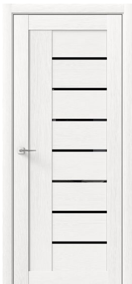
БЕТА Белый Дуб