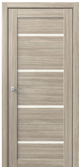
ИОТА Дуб Сицилия