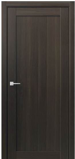
СИНГЛ Дуб Браун Глухая вставка