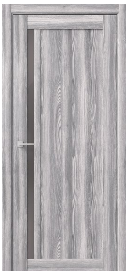
ГАММА М Ривьера Грей