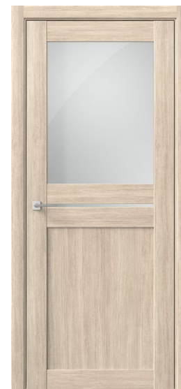
ОМЕГА С Амурская лиственница