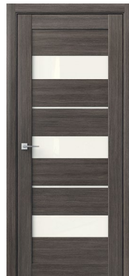
ЗЕТА Дуб Неаполь