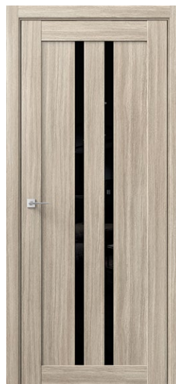
СИГМА 2 Дуб Сицилия