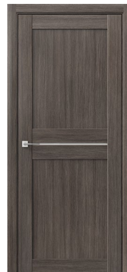
ОМЕГА Дуб Неаполь