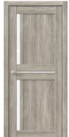
ДЕЛЬТА М Дуб пепельный