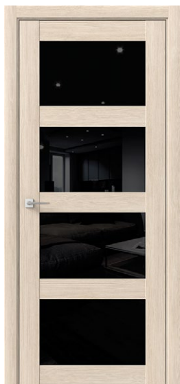
КВАТРО Амурская лиственница