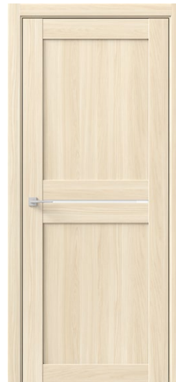
ОМЕГА Ясень Аляска