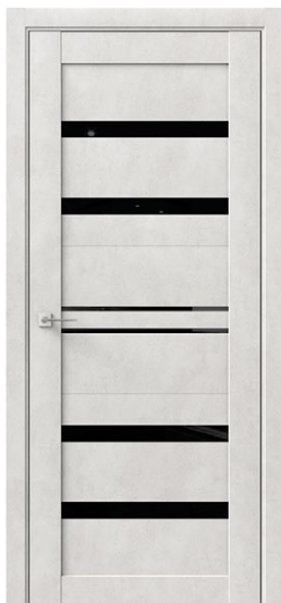
РИТМИК 6 Бетон светлый