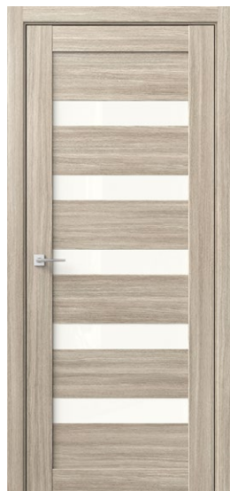
АЛЬФА 5 Дуб Сицилия