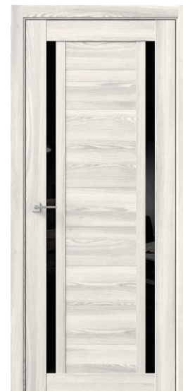
ГАММА 2 Ривьера Айс