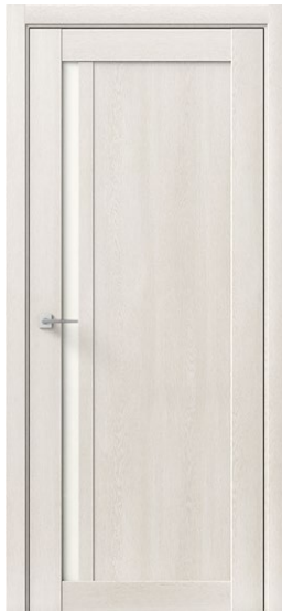
ГАММА М Дуб Браш св.