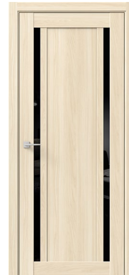
ГАММА M2 Ясень Аляска