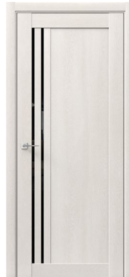
ГАММА CM Дуб Браш св.