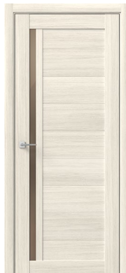
ГАММА Снежная лиственница