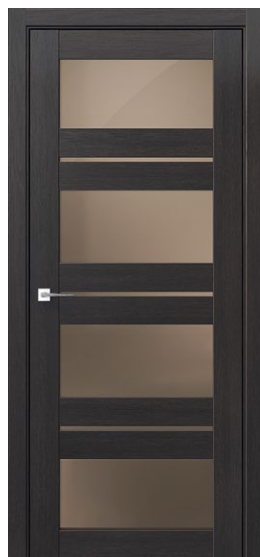
КВАТРО 7 Орех Бисмарк